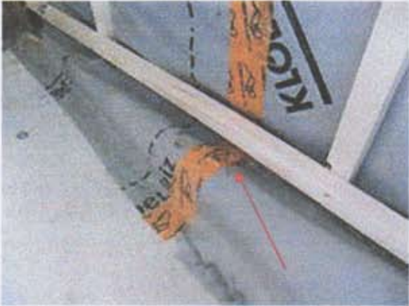
06 Infiltrations au niveau de la liaison de deux lés de freine-vapeur (face Nord-Ouest)