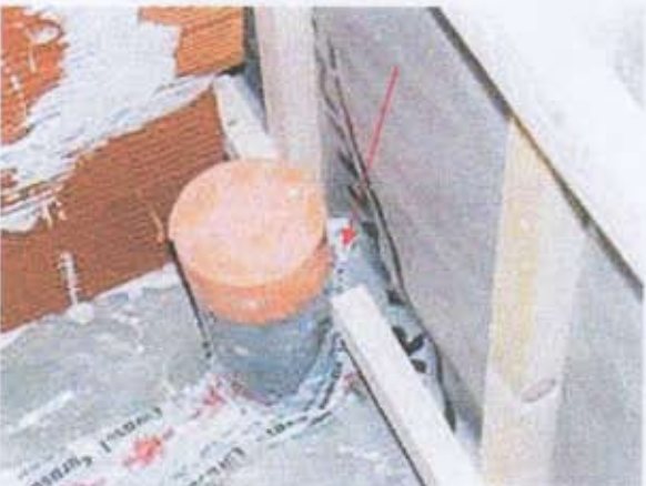
08 Infiltrations au niveau de l'évacuation du lave-linge.