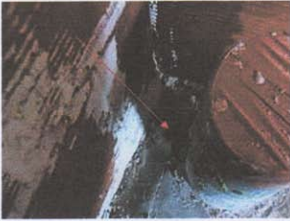
09 Infiltration au niveau de la réservation pour l'alimentation d'eau de la douche