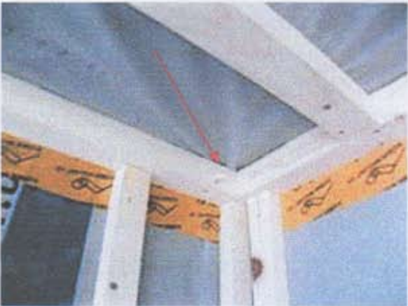
07 Infiltrations au niveau de la liaison des murs et du plafond (angle Nord).