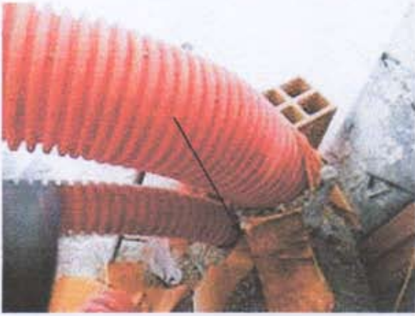
05 Infiltrations au niveau des gaines d'alimentation fluide et électrique.